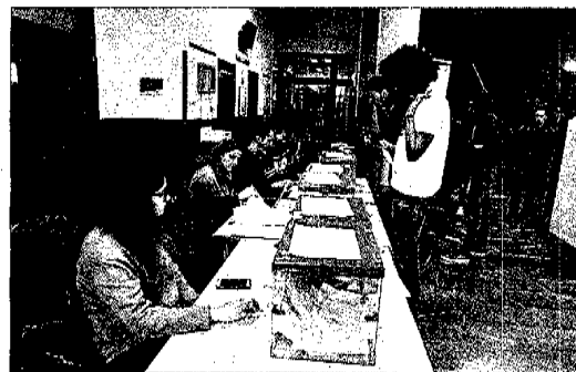
Miembros de la UIB votando ayer en el campus.

bién a sus representantes para el Consell d'Estudiants, que tendrán un mandato de dos años. Se presentaron candidatos indepen-